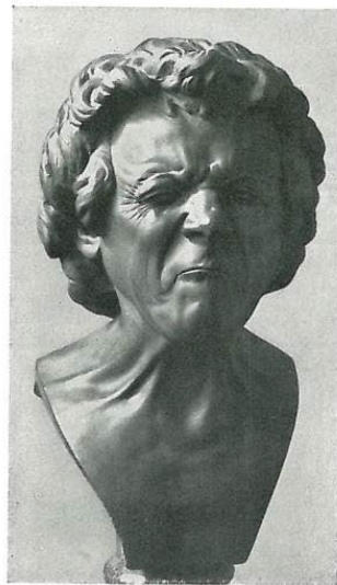
Abb. 11: „Ein abgezehrter Alter mit Augenschmerzen“

Das „Einziehen des Lippenrots, das feste Versperren des Mundes“ nach E. Kris eine Abwehrhaltung im Sinn eines „Keuschheitsgürtels“.