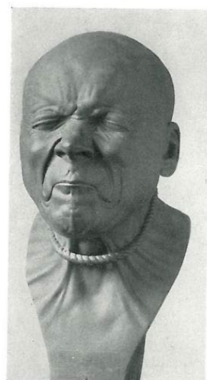
Abb. 13: „Ein Erhängter“