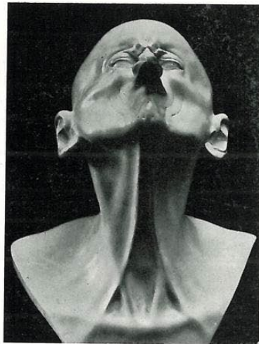
Abb. 19: „Zweiter Schnabelkopf“

Die schnabelförmig hochgezogenen Lippen „als Illustration einer Fellatio (...), zu der die Geister Messerschmidt auffordern“. (E. Kris)