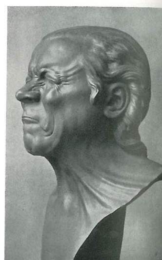
Abb. 14: „Der Verdrießliche“