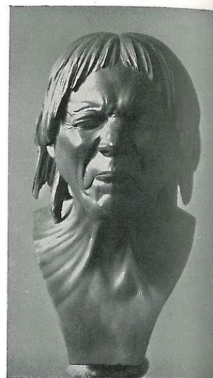
Abb. 12: „Ein aus dem Wasser Geretteter“